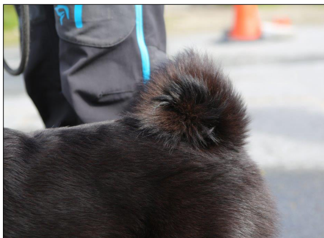
Korrekt buren svans.