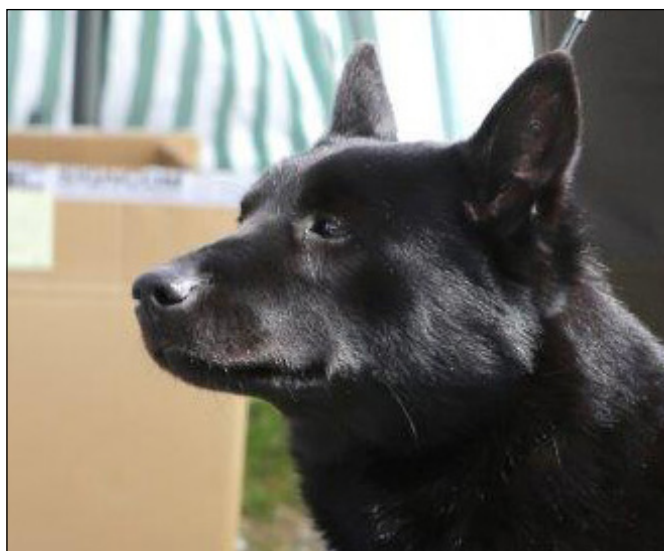
Utmärkt hanhundshuvud med tydlig könsprägel. Aningen stora öron.