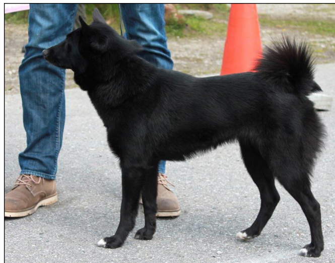
Good tik som inte får bli lättare och torrare i kroppen. Inte heller mera vitt på tassarna. Inte alltför bra överlinje och lågt ansatt svans.