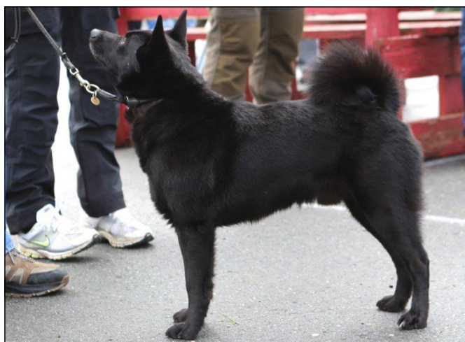
Excellent hane med fint uttryck och god resning, stark överlinje, bra kors och svans. Utmärkta vinklar fram och bak. Markerat förbröst och bra längd i bröstbenet. Tillräckligt strama tassar.