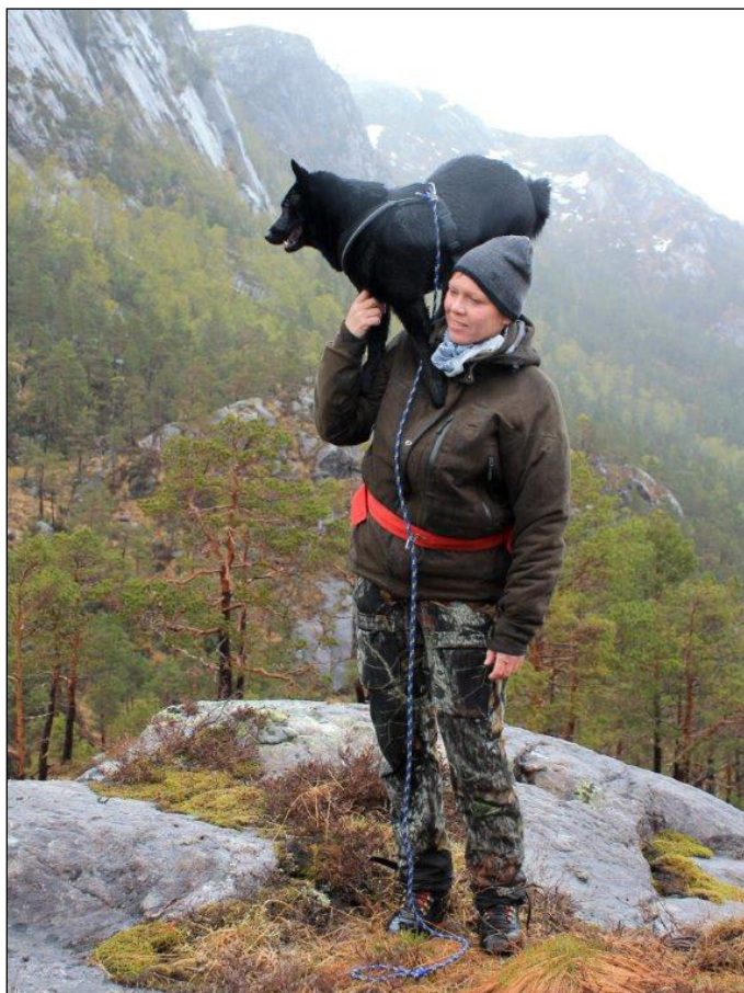
Norsk älghund svart används huvudsakligen som ledhund/bandhund på klövvilt.