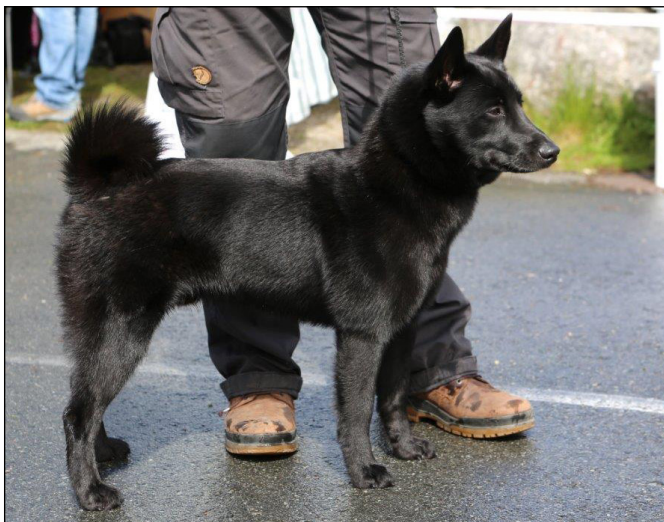
Excellent hane med lämpligt djup och välvning i bröst-korgen. Stark överlinje, och lämpligt uppdragen underlinje. Utmärkt svans.

Bröstkorgen skall vara relativt djup med väl välvda revben.