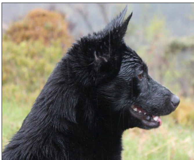
Utmärkt tikhuvud i sina proportioner, lämpligt stop, utmärkta ögon och öron, hals och nacke som ger god resning.

Halsen skall vara medellång och torr utan antydning till löst halskinn.