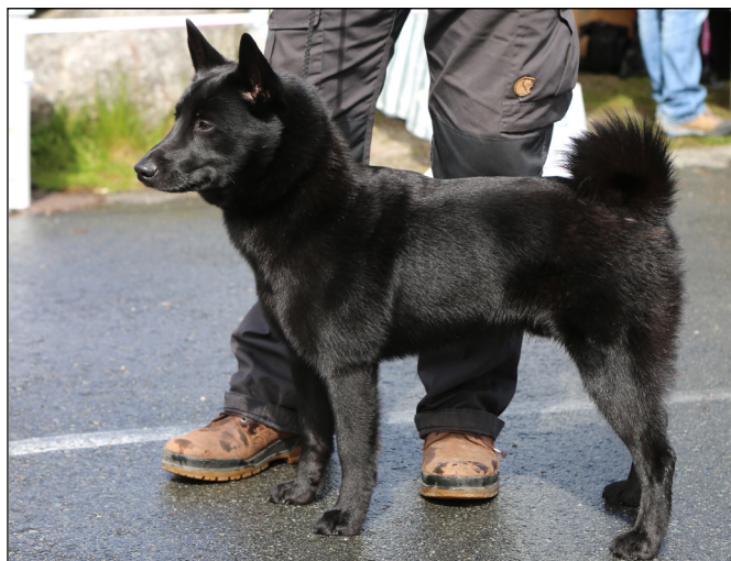
Excellent hane med utmärkta proportioner, utmärkt överlinje och svans. Utmärkta tassar.