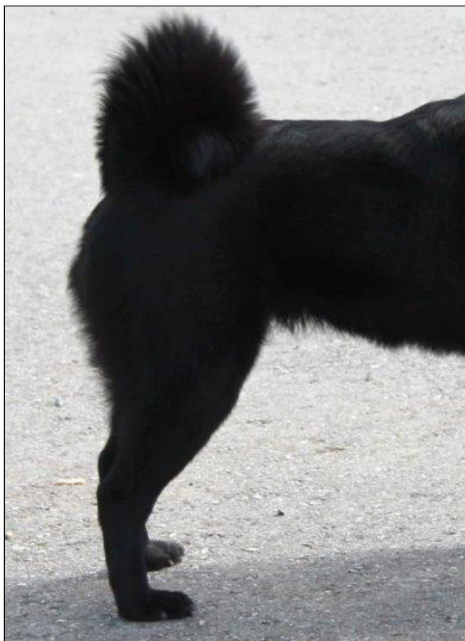
Utmärkta rasdetaljer såsom kors och svans. Välvinklat knä, brett och bra lår.

Stubbsvans ses som ett allvarligt fel, och sådan hund tilldelas högst sufficient oavsett övriga förtjänster.