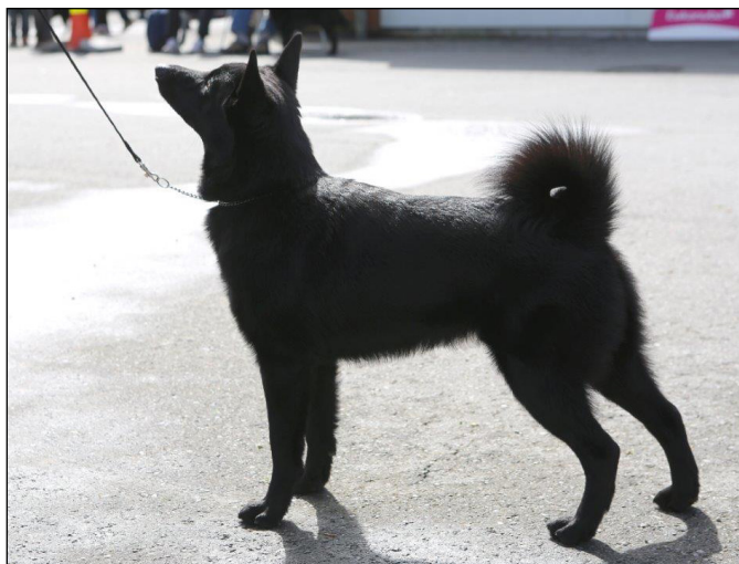
Excellent tik med utmärkt helhet, utmärkt pälskvalitet.

Norsk älghund svart skall vara modig, energisk och djärv.